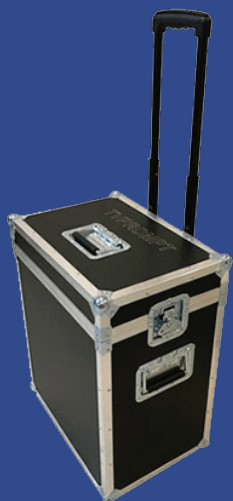
Maleta tipo TROLLEY con ruedas y asa telescópica para su fácil transporte.